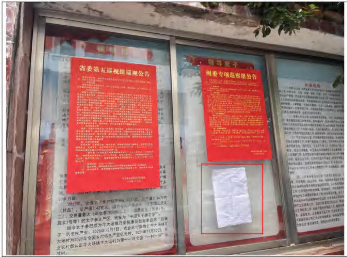
施秉县牛大场镇人民政府 图 3-2 建设项目现场公示照片