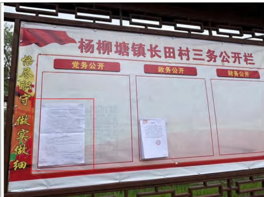
施秉县杨柳塘镇长田村村委会人民政府