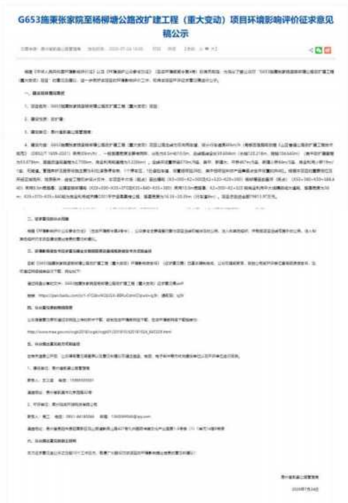
图 3-1 征求意见稿公示截图