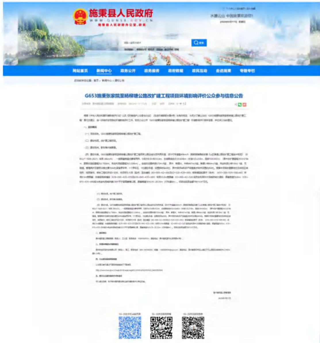
图 2-1 施秉县人民政府官网公示情况