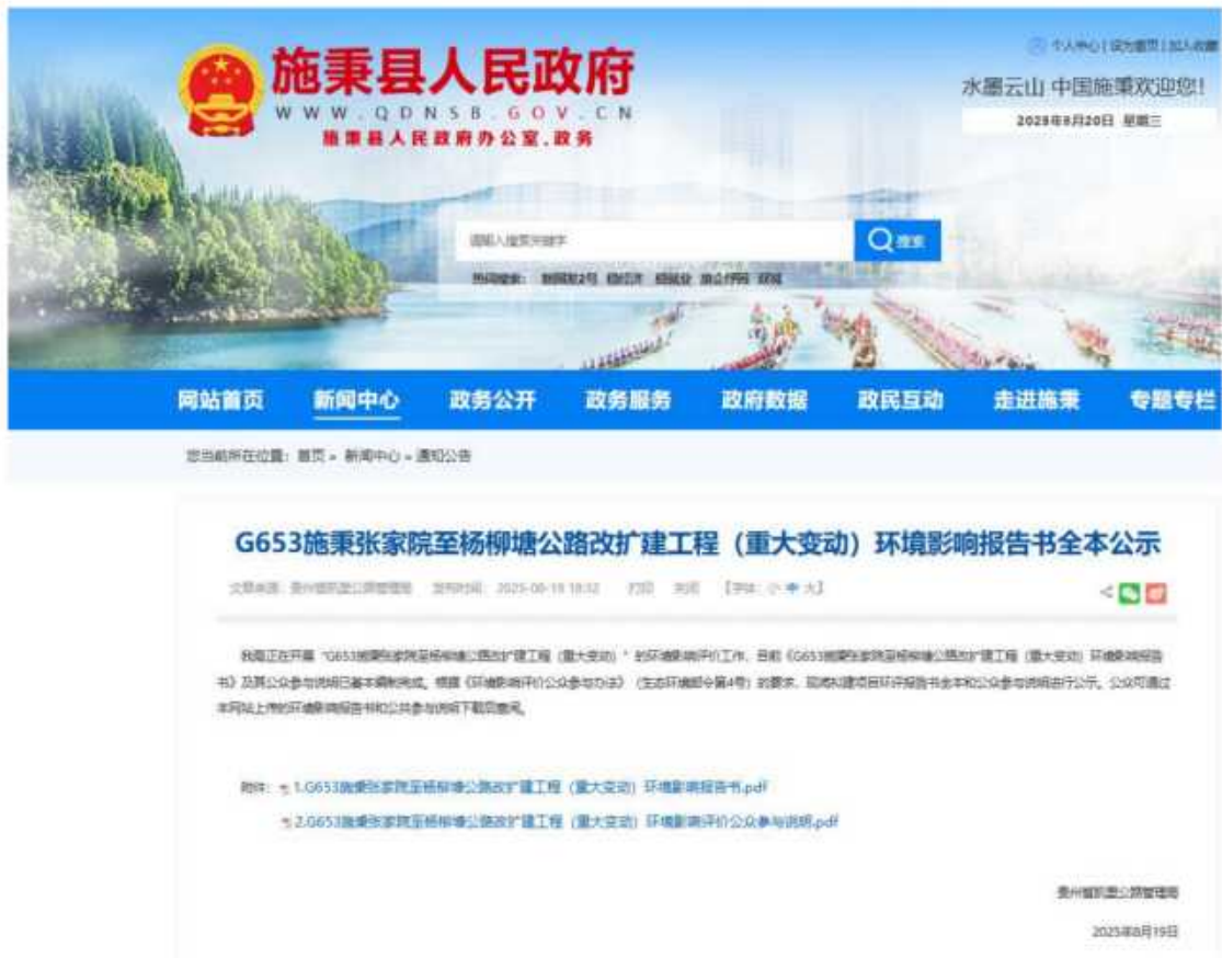
图 3-3 报批稿公示截图