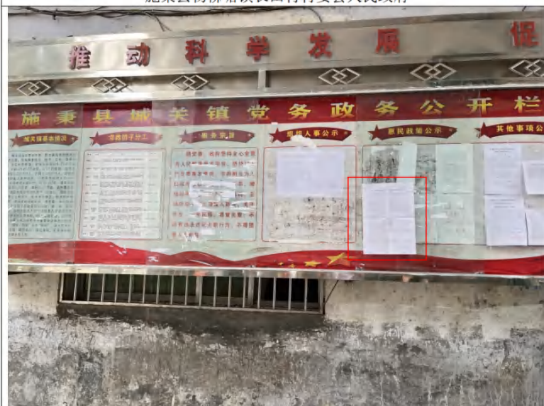
施秉县城关镇人民政府